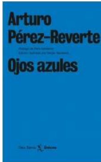
Portada de Ojos azules .