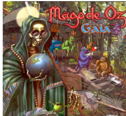
Portada de Gaia .